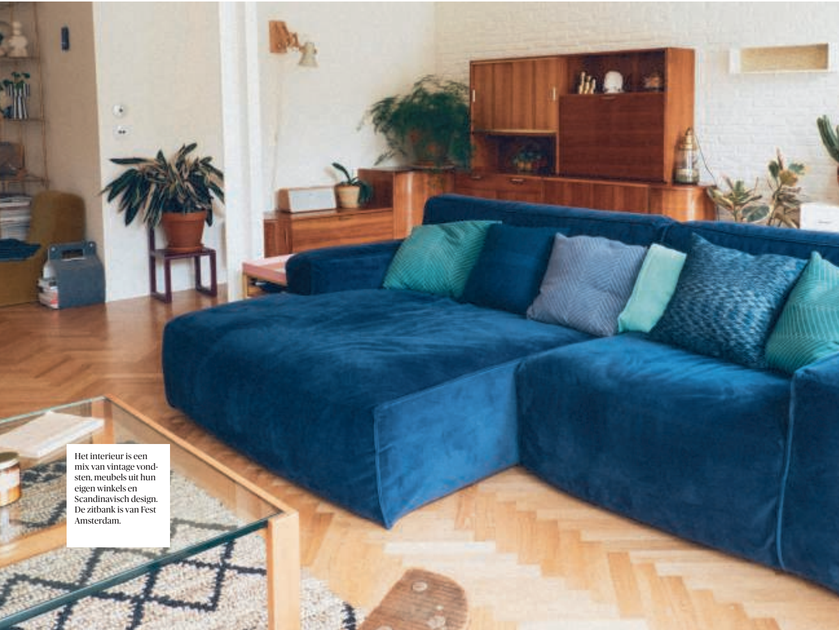
Het interieur is een mix van vintage vondsten, meubels uit hun eigen winkels en Scandinavisch design. De zitbank is van Fest Amsterdam.

in een pand met liefde voor duurzaam design