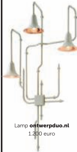
Lamp ontwerpdoo.nl 1.200 euro