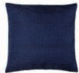
Kussen H&M Home 14,99 euro