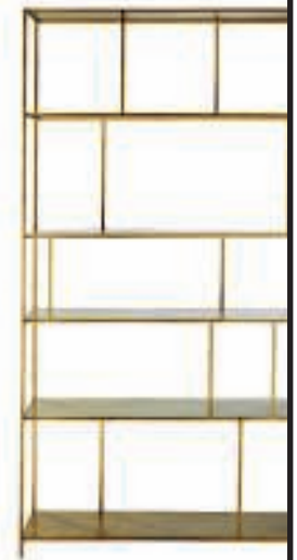
Boekenrek maisonsdumonde.com 399 euro