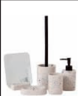
Badkamerset in terrazzo casashops.be vanaf 4,99 euro