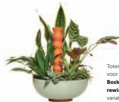
Totem-irrigatiesysteem voor planten Boskke via rewinddesign.be vanaf 11,50 euro